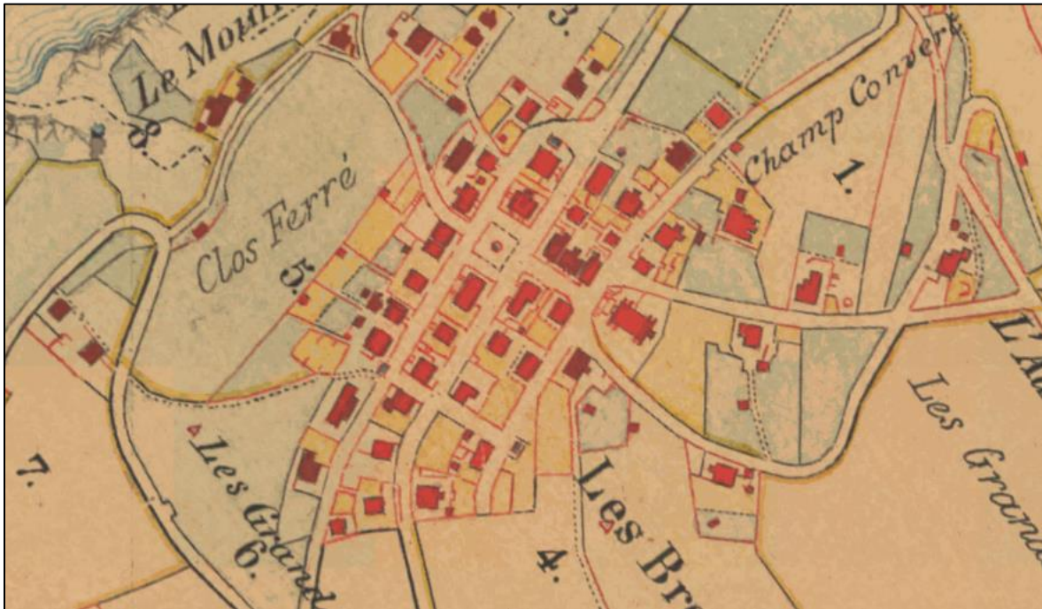
Source : Plan de répartition des folios cadastraux (1860-1890)

Comme mentionné précédemment, ce cheminement semble apparaître assez tardivement. Il relie le bas de la localité à son centre historique. Il débouche sur l'ancienne église et son clocher, accueillant depuis 1915 les services publics de la localité.