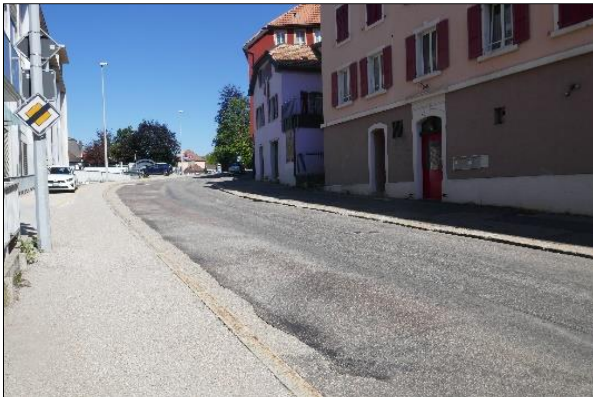
Le début de l'avenue du Collège est pour l'heure à 50 km/h avec un état de dégradation avancée.

Nous trouvons le long du tracé deux parkings, l'un sur le domaine public composé de 6 places et le deuxième sur du terrain privé communal de 18 places, loué par une entreprise horlogère de la place.