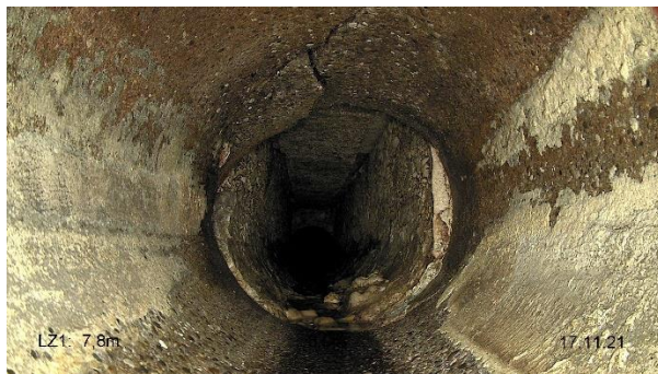
Conduite cassée en haut à gauche

Comme pour les autres tronçons de route déjà réalisés en ville, le collecteur de l'avenue du Collège est en mauvais état. En 2021, un passage caméra nous a confirmé son état de dégradation avancé.