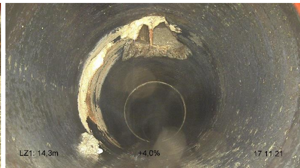
Joint déboîté et non étanche

L'ancien collecteur des eaux usées mixtes en ciment sera remplacé par une canalisation en PVC de Ø 315 mm, qui sera raccordée au collecteur de la rue de la Chapelle.