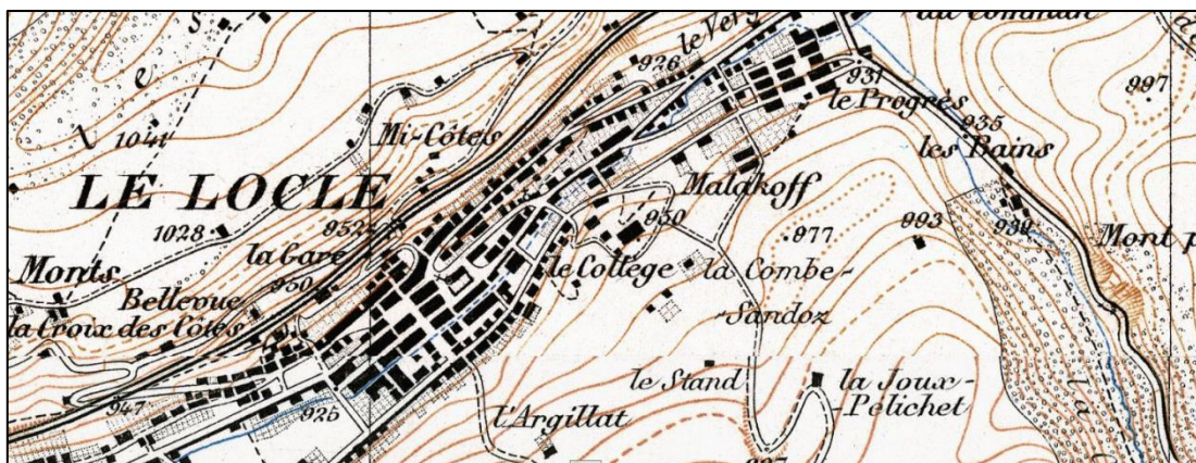
Atlas Siegfried 1870-1892

Comme souvent la localisation d'une école est sujette à de nombreuses discussions (l'État privilégiant une construction au centre de la localité ; les autorités communales de l'époque un développement hors agglomération). Au final, le collège de Beau-Site est inauguré en 1876 en amont de la localité existante, sur son coteau sud. Cette implantation reflète la volonté des autorités de garantir aux enfants une formation à l'air pur et à la lumière.