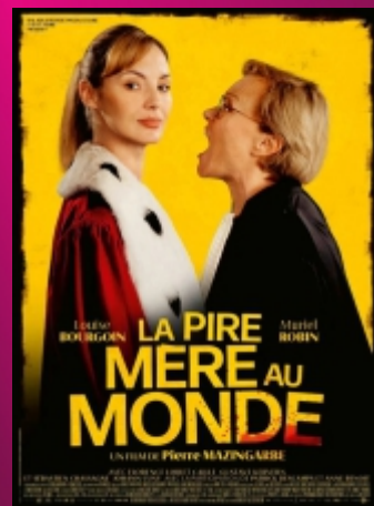
"La Pire Mère au Monde" De Pierre Mazingarbe Comédie / 1h30 / âge voir site