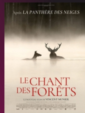
"Le Chant des Forêts" De Vincent Munier Doc. / 1h35 / 6 ans (10)