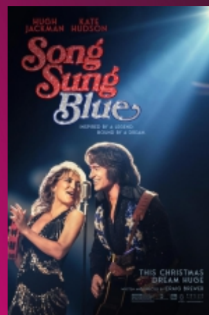
"Song Sung Blue" De Craig Brewer Drame / 2h12 / 12 ans (--)