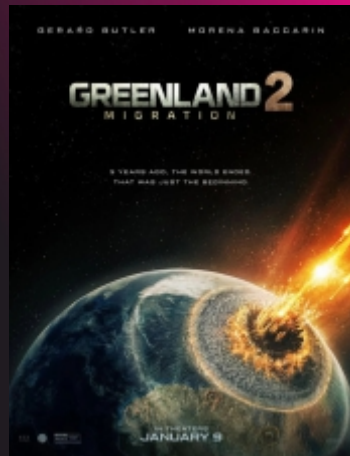
"Greenland 2: Migration" De Ric Roman Waugh Action / 1h38 / âge voir site